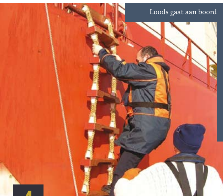
Loods gaat aan boord

In Vlissingen zien de Nederlandse en Vlaamse rededienst-