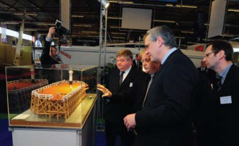
Boot Düsseldorf, 17 tot 25.01.2009