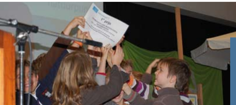
school uit Keerbergen won 1e prijs van wedstrijd verbonden aan het 'jaar van de dolfijn': vaartocht met de 'Zeeleeuw'.

sonderzoek (INBO) aan boord van de Zeeleeuw maandelijks enkele dagen in de Belgische kustwateren om het zeevogelbestand te monitoren. Bruinvissen en witsnuitdolfijnen werden vanaf het begin van deze tochten waargenomen maar de afgelopen twee, drie jaren zijn de waarnemingen van vooral bruinvissen spectaculair gestegen.